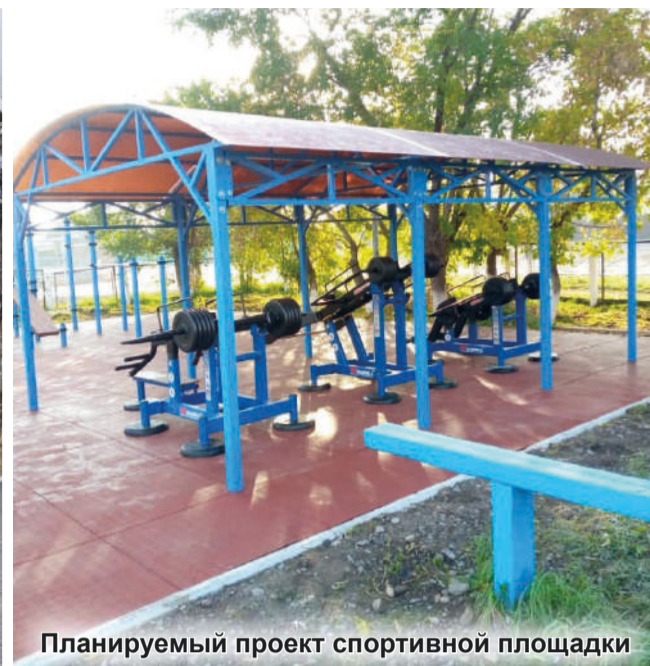
Планируемый проект спортивной площадки